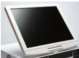
一体型10.5インチデジタル液晶