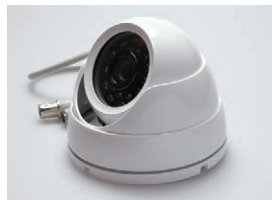
赤外線LED搭載 ドーム型カメラ