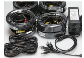
ケーブルもすべてセット!