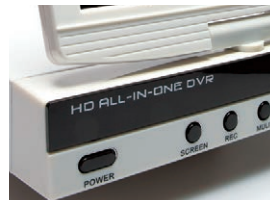
デジタルビデオレコーダー 大容量HDD 1TB!